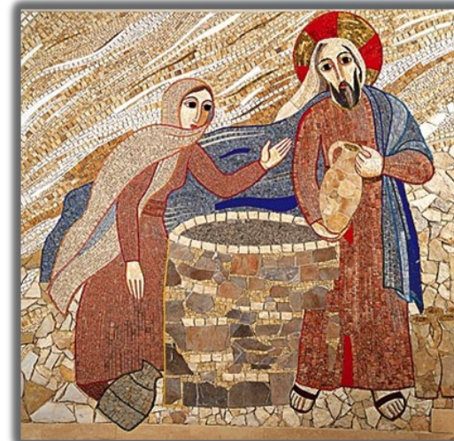
Gesù con la samaritana - M. Rupnik

Il Signore è vicino a chi ha il cuore ferito